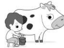
traire une vache